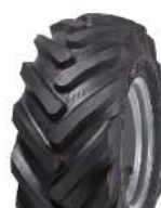
11,5 x 15 AS