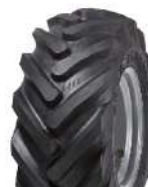
11,5 x 15 AS