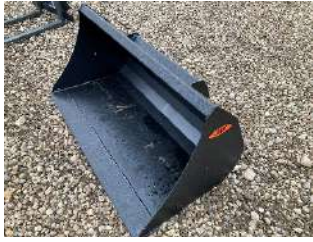
Skovl 150mm skær

Et udvalg af redskaber. Spørg om dit specifikke ønske