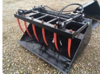
Skovl m overfald